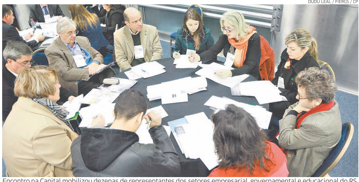
Encontro na Capital mobilizou dezenas de representantes dos setores empresarial, governamental e educacional do RS